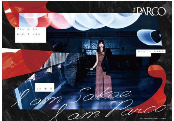
〈ポスター-B1サイズ 2種〉