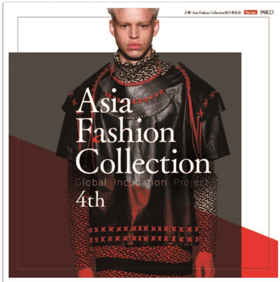
- AFC 4th (2016-2017) キービジュアル -

株式会社バンタン（本部：東京都渋谷区）と株式会社パルコ（本社：東京都豊島区）は、アジアの若手デザイナーを発掘・インキュベートするプロジェクト「Asia Fashion Collection（アジアファッションコレクション、以下 AFC）4th」の参加者を募集致します。AFCは、韓国、台湾、香港、そして日本の若手デザイナーが、ニューヨーク・ファッション・ウィークでのランウェイデビューをかけて競い合う“コンペティション”の要素と、その後、東京やアジアのファッションイベントへの参加機会提供、現役プロによるブランド独立のための実践的な支援などを通じてデザイナーの成長を促進する“インキュベーション”の要素を兼ね備えたプロジェクトで、今回で4度目の開催となります。