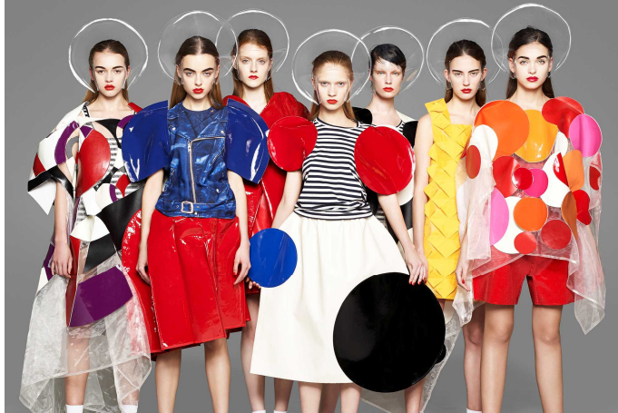
JUNYA WATANABE COMME des GARÇONS

台湾版『VOGUE』で17年間にわたって撮影したモード・ファッション写真100点余りを展示します。