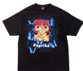
Paprika x GEEKS RULE Tシャツ