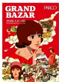
ORIGINAL POSTER GRAND BAZAR x Paprika