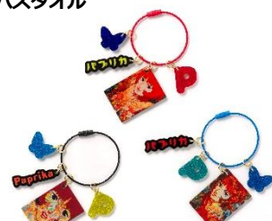
アクリルキーホルダー