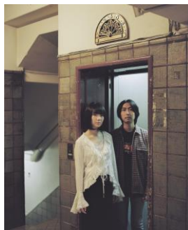
ラッキーオールドサン