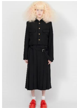
COMME des GARÇONS GIRL