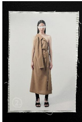
MM6 Maison Margiela