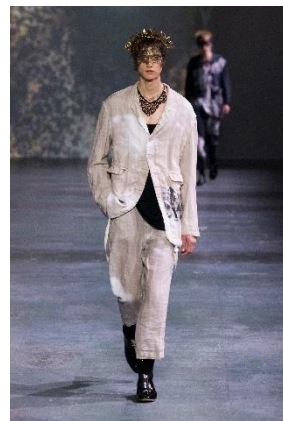
UNDERCOVER NOISE LAB