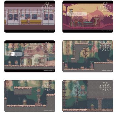
『違う冬のぼくら』トレーディング レンチキュラステッカー(全6種) 990円(税込)