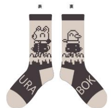
『違う冬のぼくら』 ソックス 1,980円(税込)

本グッズは2025年1月17日(金)よりONLINE PARCOでの受注販売も予定しております。 詳細は企画特設HPよりお知らせいたします。