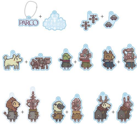
『違う冬のぼくら』トレーディング アクリルキーホルダーセット(全8種) 1,100円(税込)

『違う冬のぼくら』に登場するキャラクターをモチーフとしたグッズや、角度を変えると絵柄が変わるレンチキュラステッカー、さらには2人で使えるスウェットやクリアファイルといったオリジナルグッズを販売いたします。