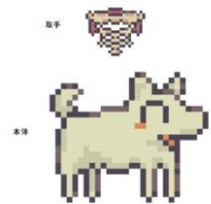
『違う冬のぼくら』骨が伸びる ぬいぐるみメジャー 2,970円(税込)