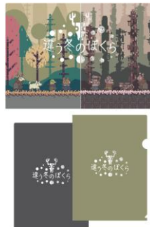
『違う冬のぼくら』 クリアファイル2枚セット 1,320円(税込)