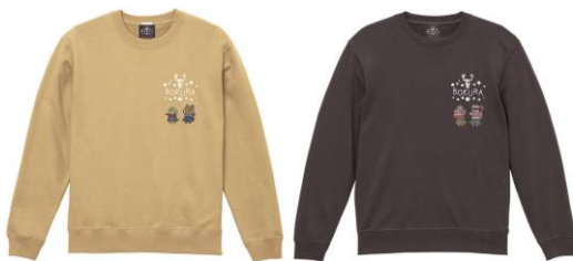
『違う冬のぼくら』 スウェット(全2種) 8,800円(税込)