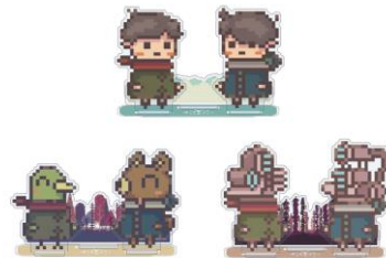
『違う冬のぼくら』 アクリルスタンドセット(全3種) 2,640円(税込)