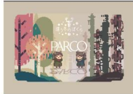
『違う冬のぼくら』 ポーチ 1,650円(税込)