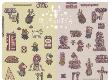
『違う冬のぼくら』 ブランケット 4,950円(税込)