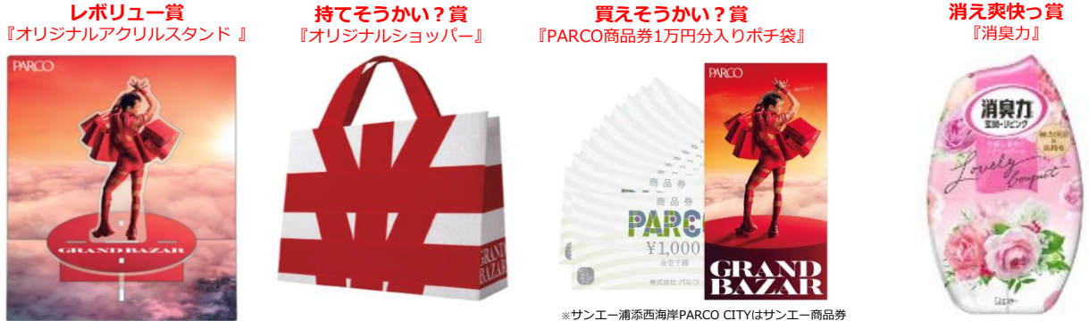
【参加賞】ナマ足魅惑のマーメイド オリジナル待受画面

※「ポケパル払い」登録画面提示で+1回（計2回）ご参加頂けます。（新規登録も含む）