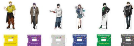
「悪意に染まったプレゼント」 アクリルスタンド 各¥1,650-