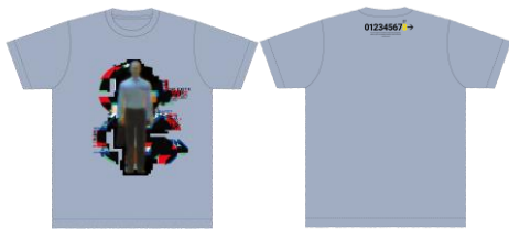
Tシャツ アシッドブルー (3サイズ展開) 各¥5,500- ※ 新商品