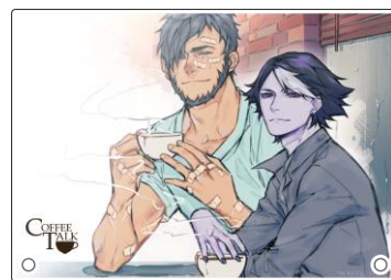
アクリルアートボード ¥2,750- ※新商品