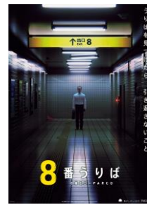
キービジュアルB3縦ポスター ¥2,090- ※ 新商品