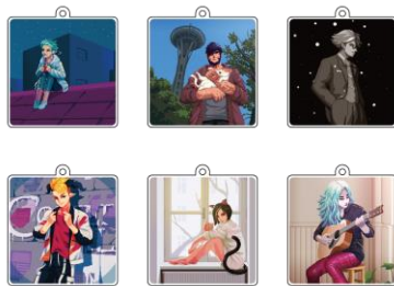
トレーディングアクリルキーホルダー (全6種・ランダム) ¥550- ※新商品