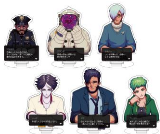
セリフ付トレーディングアクリルスタンド2 (全6種・ランダム) ¥880- ※新商品