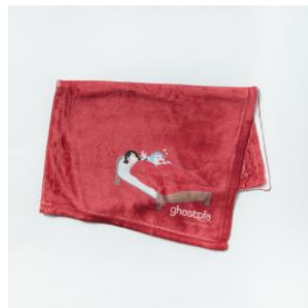
『ghostpia』小夜子のブランケット ¥4,950-