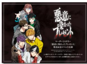
「悪意に染まったプレゼント」 発売記念イベント公演パンフレット ¥880-