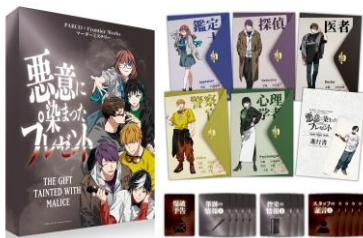
マードーミステリー 「悪意に染まったプレゼント」 ¥3,850-