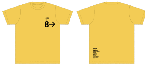
Tシャツ イエロー (3サイズ展開) 各¥5,500- ※ 新商品