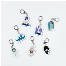
トレーディングキャラクターアクリルキーホルダー (全7種・ランダム) ¥770-