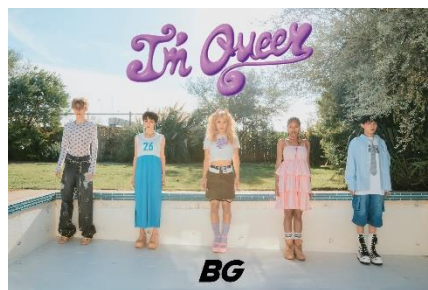
BG 〈アパレル〉 5/16(木)～5/20(月)