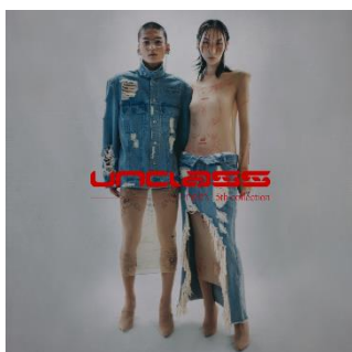
neith. 〈アパレル〉 5/8(水)～5/14(火)