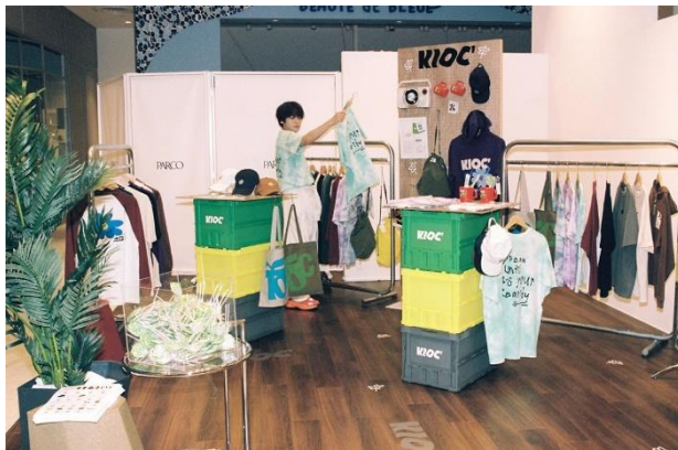
※2023年6月 店舗受注会 会場写真