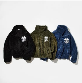
↑ポアビッグブルゾン 価格：15,000円（税込） カラー：ブラック、カーキ、ブルー サイズ展開：M、L