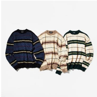
↑マルチボーダーニット 価格：9,900円（税込） カラー：ネイビー、アイボリー、グリーン サイズ展開：F