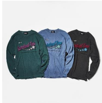
↑ビッグメントロングスリーブTシャツ 価格：8,800円（税込） カラー：グリーン、ブルー、グレー サイズ展開：M,L