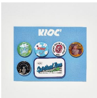
↑缶バッジセット6個入り 価格：2,400円（税込）