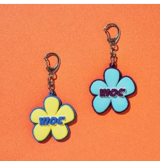
↑フラワーロゴキーホルダー 価格：1,650円（税込） カラー：イエロー、ブルー