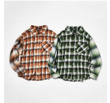
↑キリカエチェックシャツ 価格：8,250円（税込） カラー：オレンジ、グリーン サイズ展開：F