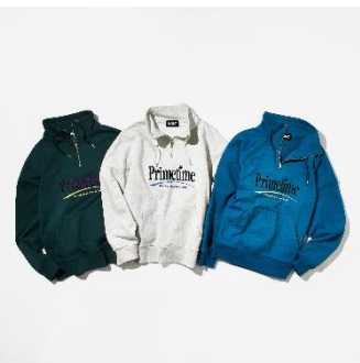
↑セッション ハーフジップスウェット 価格：9,460円（税込） カラー：グレー、グリーン、ブルー サイズ展開：M,L