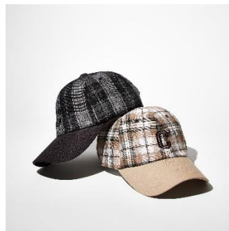
↑チェックCAP 価格：5,500円（税込） カラー：ベージュ、ブラック サイズ展開：F