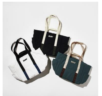
↑2ハンドルナイロントートバッグ 価格：7,700円（税込） カラー：ホワイト、ブラック、カーキ