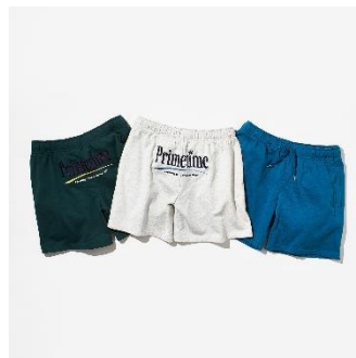
↑セッション ハーフパンツ 価格：6,800円（税込） カラー：グレー、グリーン、ブルー サイズ展開：M,L