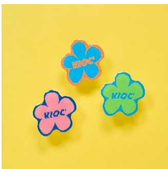
↑フラワーロゴスマホグリップ 価格：1,800円（税込） カラー：ブルー、グリーン、ピンク