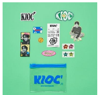
↑ステッカーセット(ロゴ袋付き) 価格：2,800円（税込）