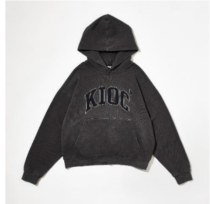
↑カレッジロゴフーディ/ 価格：11,900円（税込）/ カラー：アイボリー、パープル、チャコールグレー/サイズ展開：M,L