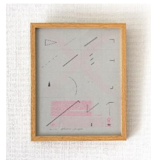
包装紙の為のモチーフ ¥29,000