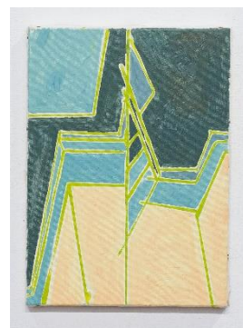
corner of rooftop(seto site) ¥33,000

Instagram: @taikifuruhata HP: http://www.cafebarrack.com/