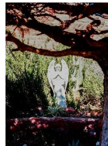
Other Space, Other Points ¥58,500

Instagram: @adachiryoppm HP: https://www.adachiry.com/