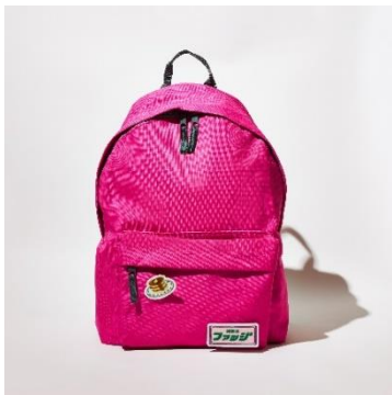
ワッペンデイバック ¥12,000+tax