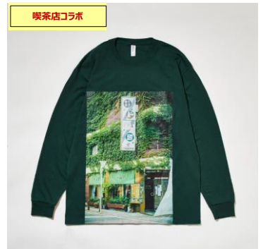
フォトプリントロングスリーブTシャツ 喫茶ドレミ ¥10,000+tax /各