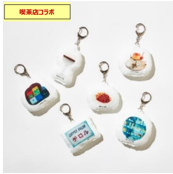
クッションキーホルダー コーヒーサロンチロル、喫茶サテラ 喫茶ボンボン、喫茶ドレミ、喫茶マツ ラ、珈琲王城 ¥1,800+tax /各