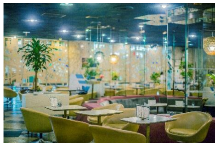
マツラ喫茶店 (北新地)