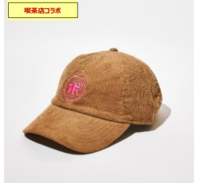
コーデロイキャップ 喫茶ボンボン ¥9,800+tax