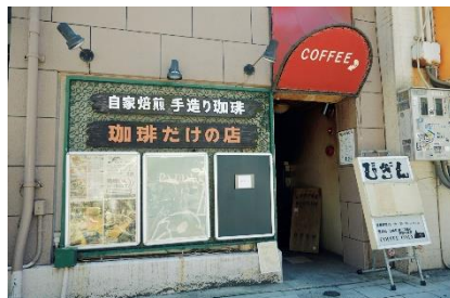
珈琲だけの店びきん