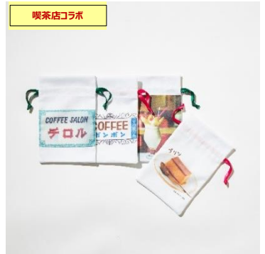
巾着ポーチ コーヒーサロンチロル、喫茶ボンボン、 喫茶ドレミ、喫茶サテラ ¥1,800+tax /各