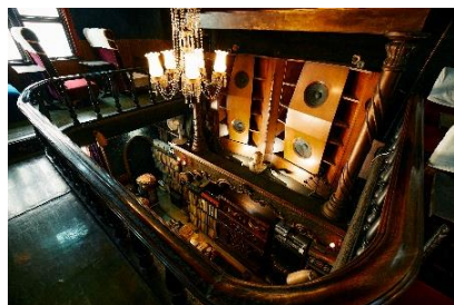
名曲喫茶ライオン (渋谷)