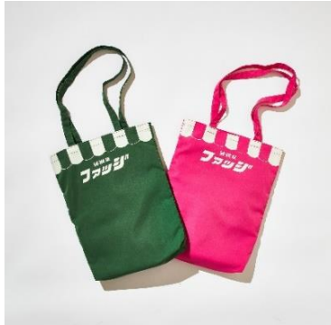
純喫茶ファッジロゴ トートバッグ ¥2,000+tax/各