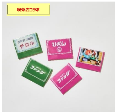
紙石鹸 珈琲王城、喫茶サテラ、コーヒーサロンチロル、 珈琲だけの店びぎん、シャモニーモンブラン ¥490+tax /各