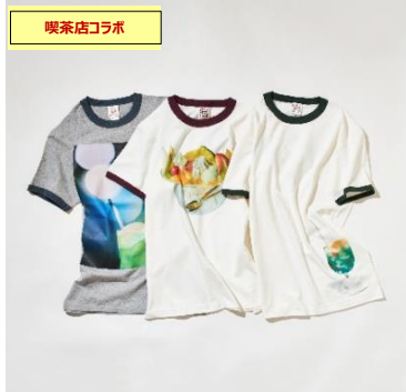
リングアTシャツ 喫茶マツラ、喫茶ドレミ、珈琲王城 ¥6,500+tax /各