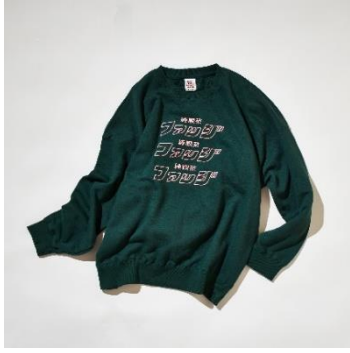
純喫茶ファッジロゴ スウェット ¥8,900+tax サイズ M・L