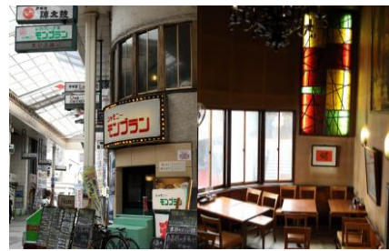
シャモニーモンブラン本店