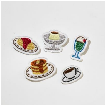
刺繍ワッペン ¥1,700+tax~/各 ※大きさ・種類により異なります。