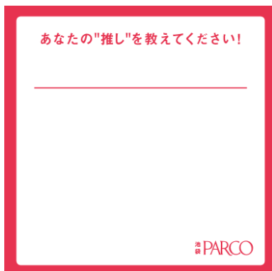
▲専用メッセージカード

期間中、専用メッセージカードにあなたの推しを書き込んで、推し活メッセージボード貼り付けてください！ 書き込んだメッセージカードをスマホで写真撮影し、池袋PARCO LINE@のトーク画面に送信してくれた方の中から抽選で1名様に、推し活遠征費の軍資金としてHIS旅行券5万円分をプレゼントいたします。 ※メッセージカード・ペンはメッセージボードの横に設置いたしますのでご自由にご使用ください。