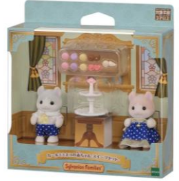
カールミネコの赤ちゃん-スイーツセット 3,000円(税込)