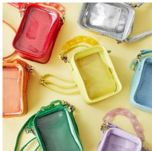
■WEGO カラフルチェーンぬい痛ショルダー (全12色展開)