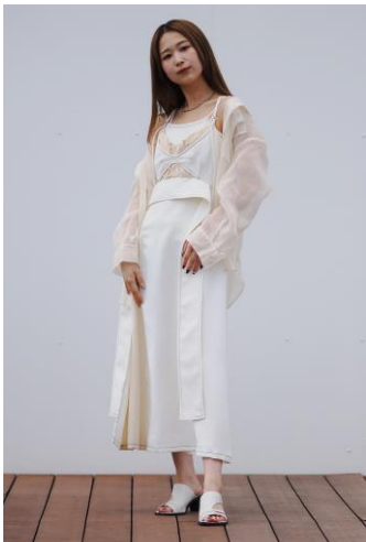
■パブリックトウキョウ