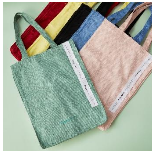
■フランフラン ロゴトート M(全10色展開)