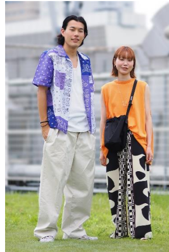
■ジャーナル スタンダード