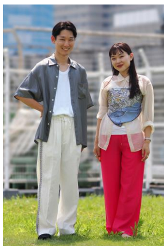
■ユナイテッドアローズ