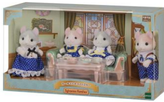
カールミネコファミリー 5,200円(税込)