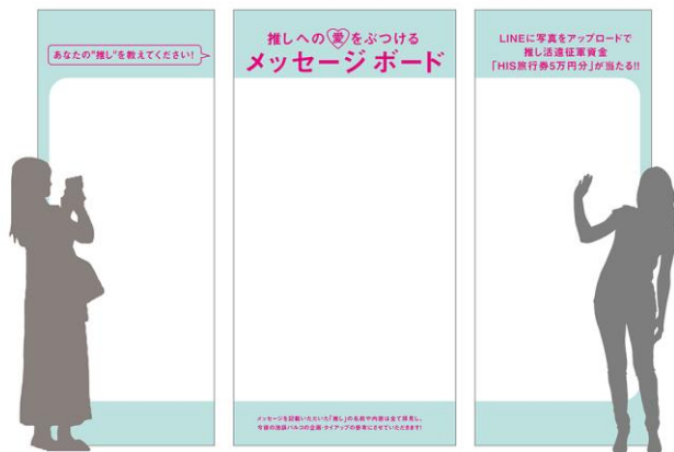
▲メッセージボードイメージ

SNSでも「推し」への愛のメッセージを募集！ 抽選で1名様に「推し」を応援できる「広告枠」をプレゼント