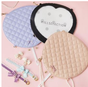
■ウィルセクション うちわケースショルダー ■ロジータ 推しカラーフリルリボンクリップSET フリルリボンハートビジュブレスレット