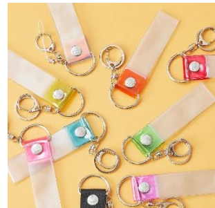
■タワーレコード 銀テープキーホルダー (全20色展開)