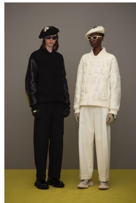
UNDERCOVER NOISE LAB