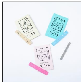
<吉田ヤスリ製作所>