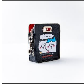
<ディスクユニオン/ユニオンレコード>