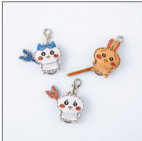
<オジャガデザイン>