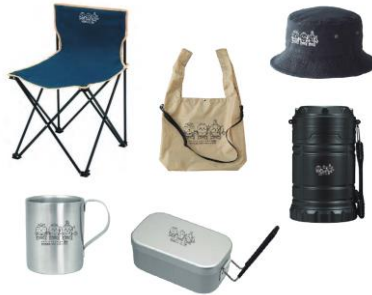
【5名様】オリジナル アウトドアグッズセット