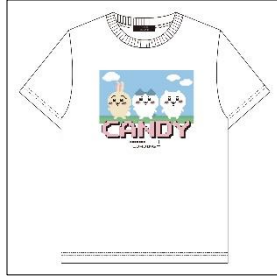
<キャンディストリッパー>