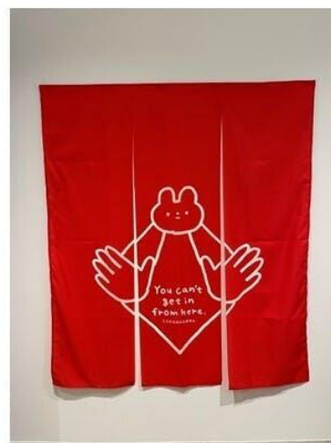
16,000円 のれん(裏) 「きっこうちゃん」

3) キャンバスアート 2種類 (すべて一点もの) 1セット33,000円 ※消費税・送料込み