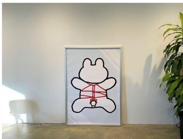
33,000円 キャンバスアート(バック) 「きっこうちゃん」

3) キャンバスアート 2種類 (すべて一点もの) 1セット33,000円 ※消費税・送料込み