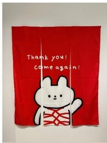
16,000円 のれん(表) 「きっこうちゃん」

2) のれん 2種類 (すべて一点もの) 1セット16,000円 ※消費税・送料込み