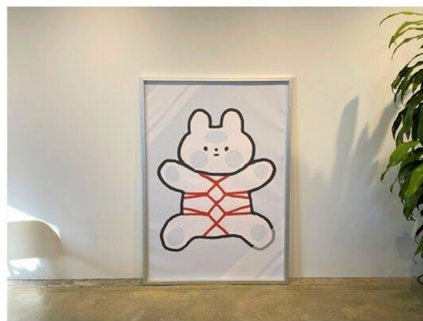
33,000円 キャンバスアート(フロント) 「きっこうちゃん」