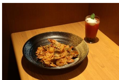
<浦和コルソ> B1F 壁の穴 (左)燃え上がる赤いスバゲッティー 1,540円 (右)ブラッドタビオカ 748円