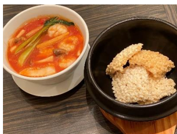
<浦和パルコ> 5F ロブノール 海老とトマトのまっかな おこげ 1,650円

・販売期間：2020年10月7日（水）より順次販売開始 ※各店なくなり次第終了 ※下記商品は一部となります