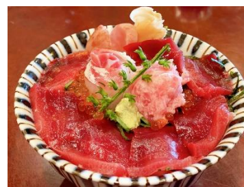
<伊勢丹浦和店> 7F 寿司清 鉄火丼 2,100円