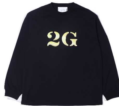
2G BIG LOGO L/S TEE (2G OSAKA限定) ¥7,800