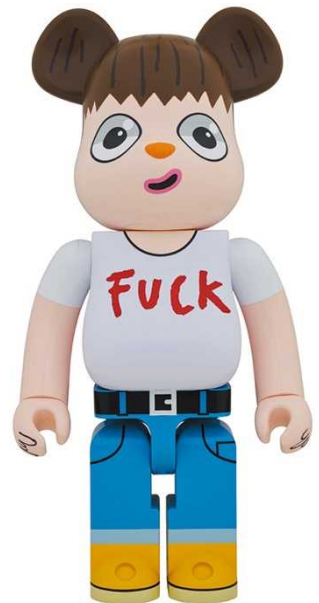
BE@RBRICK JAVIER CALLEJA 1000% ¥58,000