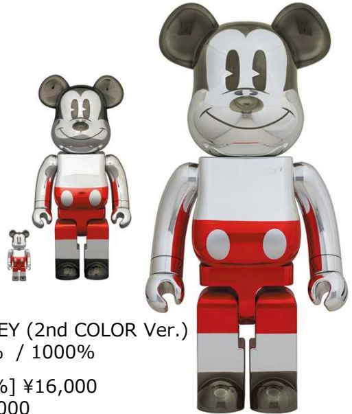
BE@RBRICK FUTURE MICKEY (2nd COLOR Ver.) 100% & 400% / 1000% [100% & 400%] ¥16,000 [1000%] ¥68,000