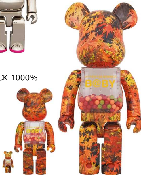
MY FIRST BE@RBRICK B@BY AUTUMN LEAVES Ver. 100% & 400% / 1000% [100% & 400%] ¥13,000 [1000%] ¥58,000 Designed by CHIAKI (CIROL & Co.)