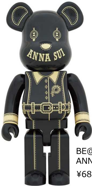
BE@RBRICK ANNA SUI BLACK 1000% ¥68,000