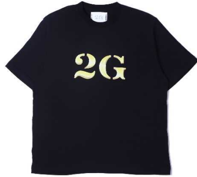
2G BIG LOGO TEE (2G OSAKA限定) ¥5,800