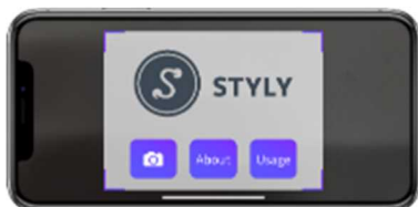
鑑賞用アプリ「STYLY」を起動

体験方法：お客さまのお持ちのスマートフォン/タブレットでご体験いただけます。会場にて掲出されたマーカー(QRコード)をアプリで読み込むことにより、空間上に浮かび上がるアートをお楽しみいただけます。