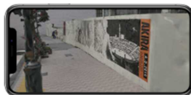
スマホにコンテンツが表示