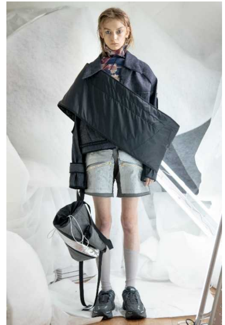
ブランド2019A/wルック 左からNON TOKYO、BODYSONG.、BALMUNG

「NEXT AGE PARCO」は「日本の若手デザイナーの発掘と支援」を目的としたプロジェクトとなり、今回のファッションショー支援より始動します。パルコは本プロジェクトで、国内の若手3ブランドのRakuten Fashion Week TOKYO公式スケジュールにおけるショー開催を支援いたします。今回、「NON TOKYO(ノトーキョー)」、「BODYSONG.(ボディソング)」、「BALMUNG(バルムング)」が渋谷PARCOでのポップアップショップ「Designers POPUP by MetroTOKYO」の販売促進も兼ね、ショーを行います。