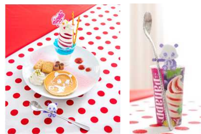
バナップandaspoonホルダー 期間中、各店舗でニコラコラボメニューをご注文頂いた方にプレゼント！ ※数量限定につき無くなり次第配布終了致します。