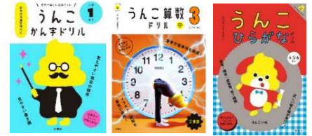
(左)うんこかん字ドリル1年生(中)うんこ算数ドリル3年生(右)うんこひらがなドリル

子どもたちにとって「うんこ」とは口にするだけで楽しくなる魔法の言葉。『うんこドリル』は、勉強を楽しいものに変えるべく「うんこ」という言葉の不思議な魅力をフル活用してつくったドリルで、子どもたちに笑顔で机に向かってもらいたいという願いがこめられています。『うんこ漢字ドリル』をはじめとして、シリーズ累計発行部数は490万部を突破。未就学児向けドリルや算数ドリルなどラインナップも拡大しています。