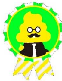
オリジナルステッカー