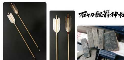
上) 奉納矢・銘切りプレート