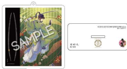
上) 刀剣男士 石切丸亚克力スタンドキーホルダー