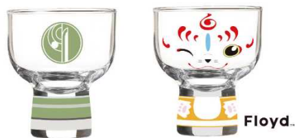
上) 刀剣男士紋・このすけこけしグラス