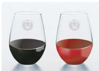
上) 石切劔箭神社 漆グラス