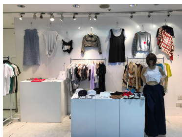
NEVERENDING STORE (2016年)