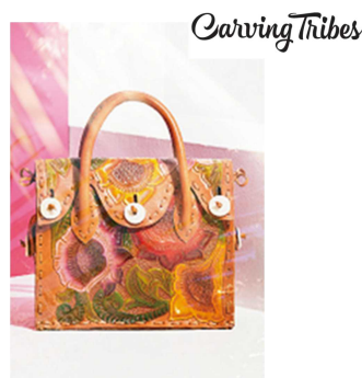
福岡 PARCO 本館 2F Carving Tribes