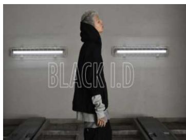
名古屋 PARCO 南館 4F ブラックアイディー

アクションスポーツブランド DC の世界観を体感できる「 DC ストア 」やストリートカルチャーを軸にダンス・カルチャー、サブカル、LGBT を取り入れたファッションスタイル「 XXXXY TOKYO 」（エクスエクスエクスホワイトキー）、 STREET & MODE スタイルに欠かすことのできないトレンドのアイテムを揃えた「 BLACK I.D 」（ブラックアイディー）、フェスファッションをリアルユースに落とした「 ハイパークチュール 」の名古屋初出店を含む 4 店舗がオープンします。