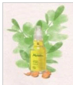
名古屋 PARCO 西館1F メルヴィータ

Melvita french organic beauty care since 1983