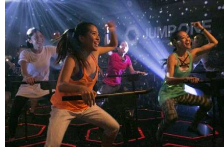
渋谷 ZEROGATE B1F jump one Shibuya