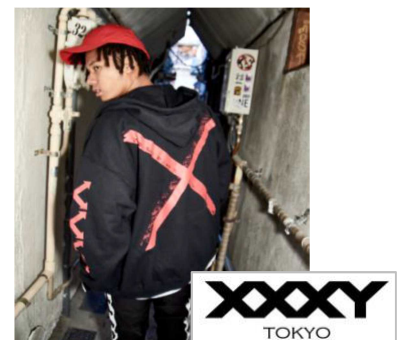
名古屋 PARCO 南館 4F エクスエクスエクスエクスホワイトキー