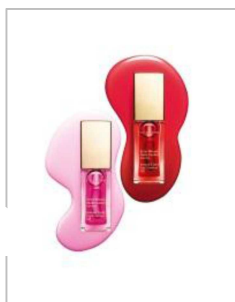
名古屋 PARCO 西館1F クラランス

Melvita french organic beauty care since 1983