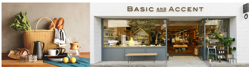
広島 PARCO 新館 2F BASIC&amp;ACCENT

また、浦和 PARCO では 3F の「 Franc franc 」と「 ロフト 」をリニューアルし、コスメやステーショナリー雑貨など、お客様のさまざまなニーズにお応えいたします。