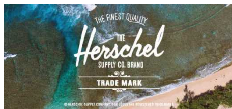
福岡 PARCO 本館 3F HERSCHEL SUPPLY COMPANY

福岡 PARCO では、本館 3F に九州初出店となるカナダ発のバッグブランド「 HERSCHEL SUPPLY COMPANY 」(ハーシェル サプライ カンパニー)や、本館 2F にはグレースコンチネンタルから生まれたバッグブランドで、板を CARVE(彫刻)してハンドステッチで繋いで作り上げる手法が特徴的な「 Carving Tribes 」(カービングトライブス)が登場し、より幅広いお客様に対応いたします。