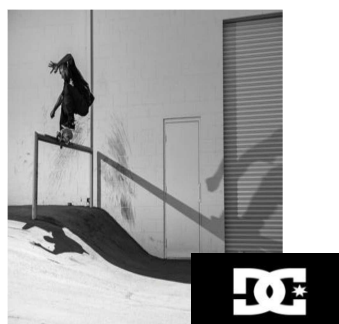
名古屋 PARCO 南館 4F ディーシーストア