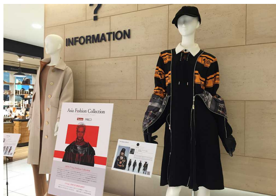
2017年4月3日～4月16日 池袋パルコ作品展示