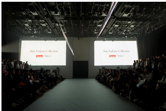
2016年10月16日 東京でのランウェイショー