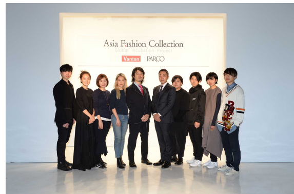
2017年2月11日 NY・ファッション・ウィーク