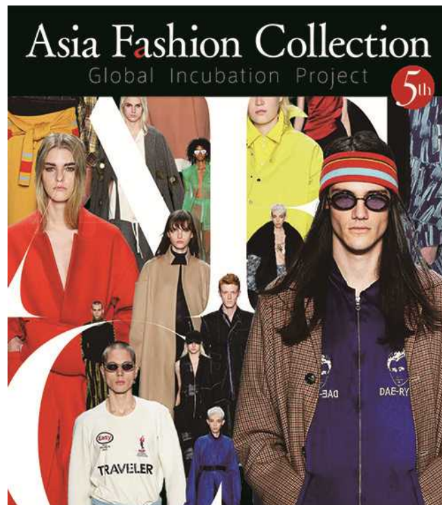
- AFC 5th (2017-2018) キーヴィジュアル -

今回は、オリジナルテキスタイルサポートに関しては審査段階からテキスタイルメーカーとのマッチングを行い、審査作品から提供を受けられるようにし、さらに最終選考者のブランドオリジナル WEB サイト制作を新たに実施致します。今後もこの様なブランド事業化に向けた支援プログラムをさらに強化していきます。