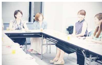
電通女性社員チーム 「ワタシゴト」