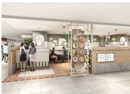
パースはイメージです