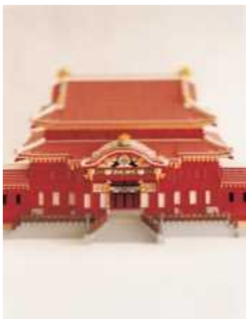
日本国 琉球王国のグスク及び関連遺産群 (レゴ®ブロック作品：首里城)