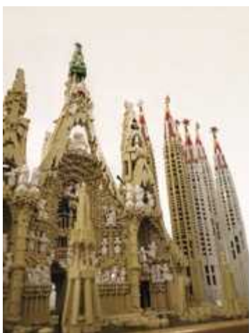
スペイン アンтони・ガウディの作品群 (レゴ®ブロック作品：サグラダ・ファミリア)