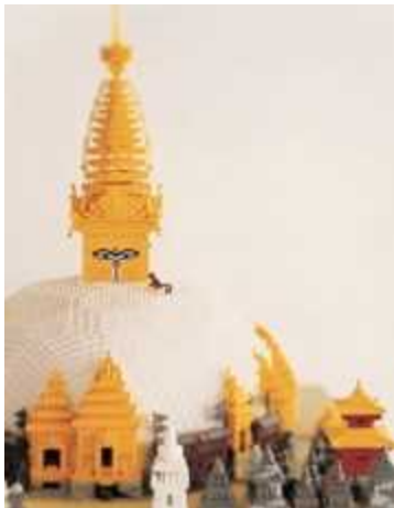
ネパール連邦民主共和国 カトマンズの谷 (レゴ®ブロック作品：スワヤンブナート寺院)