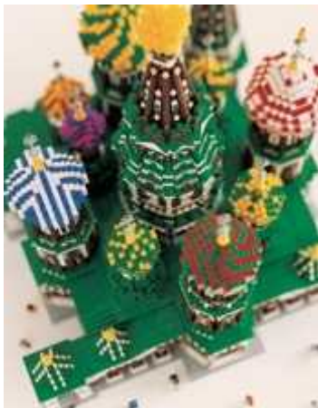
ロシア モスクワのクレムリンと赤の広場 (レゴ®ブロック作品：聖ヴァシーリー大聖堂)