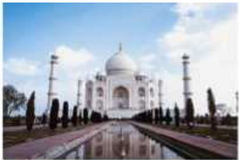
インド / タージ・マハル