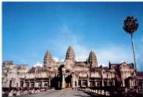
カンボジア王国 / アンコール