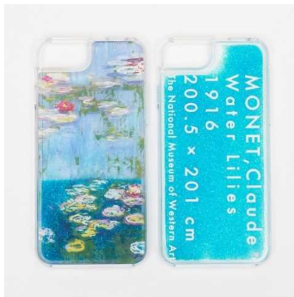
睡蓮スマホケース/絵 ¥3,800 + 税