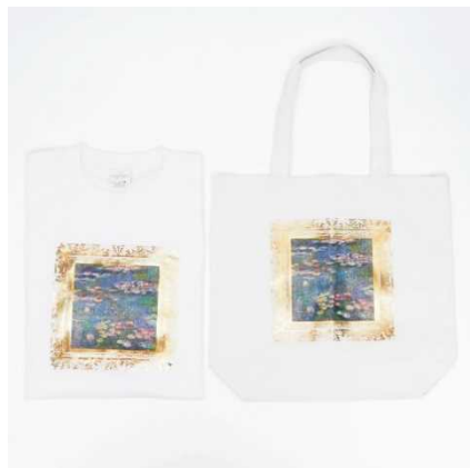
睡蓮Tシャツ ¥4,800 + 税