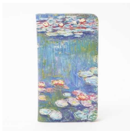
睡蓮手帳型スマホケース/絵 ¥3,800 + 税