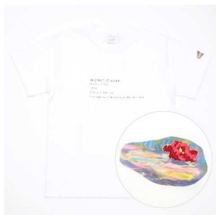
睡蓮刺繍Tシャツ ¥4,200 + 税