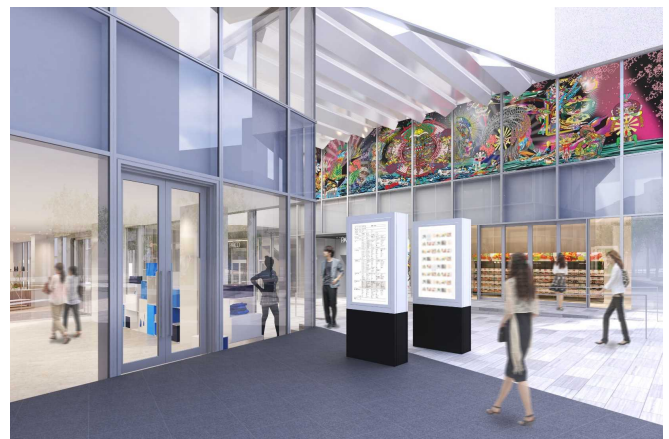
元CG作成: 竹中工務店