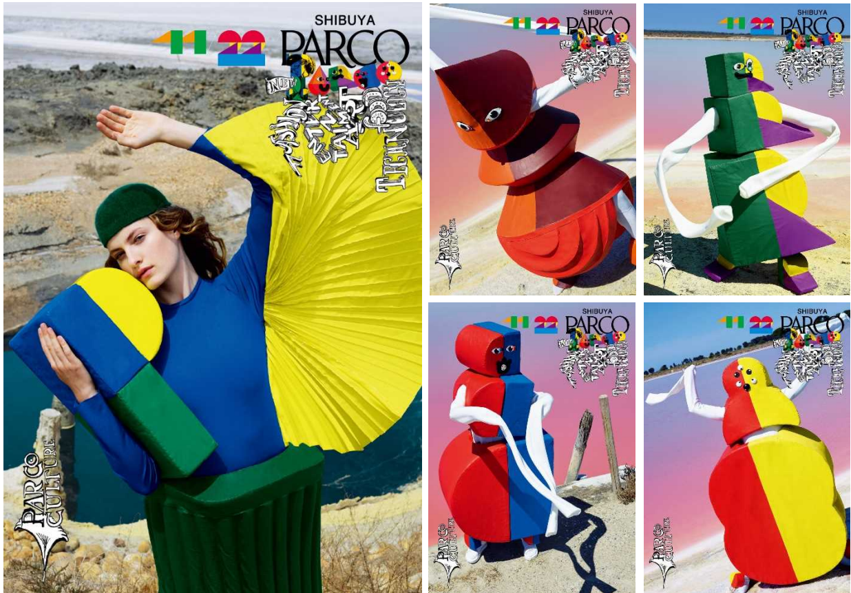
【渋谷PARCO オープン広告第1弾 TEASER編】 グラフィック(5種)

株式会社パルコ(本部:東京都渋谷区、代表執行役社長:牧山浩三、以下パルコ)は、渋谷PARCOを2019年11月22日(金)にグランドオープンします。