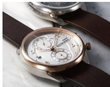
3) MASTER WORKS