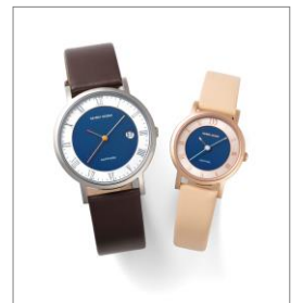
4) DANISH DESIGN