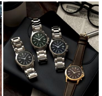
2) Movement in Motion