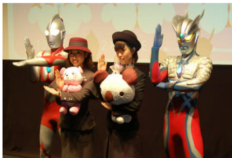
●ウルトラマン・ウルトラマンゼロと 大丸松坂屋・パルコのご案内係が共演！

◎開催日：平成25年2月28日（木）/場所：シネクイント（渋谷パルコパート3・8階）