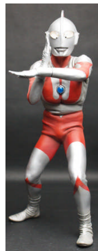
*監修中のため実際の商品と異なる場合があります