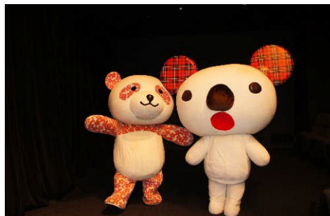
●両社キャラクター「さくらパンダ」「パルコアラ」も登場！