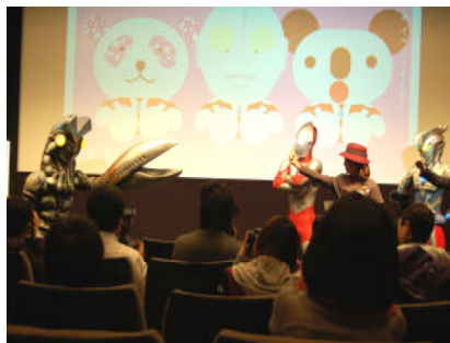
●バルタンジャンケンで対決！