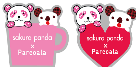
さくらパンダ×パルコアラピンバッジ

東北応援チャリティー企画として、人気キャラクターの「さくらパンダ」と「パルコアラ」が仲良く並んだピンバッジ2種類、各200円を特別販売。（ピンバッジの収益金の一部は、NPO法人「世界の子どもにワクチンを日本委員会」が行う東日本大震災被災地支援「JCV子どもの笑顔プロジェクト」に寄付いたします。）