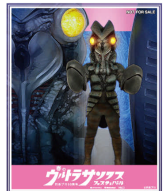
「バルタン星人オリジナルステッカー」