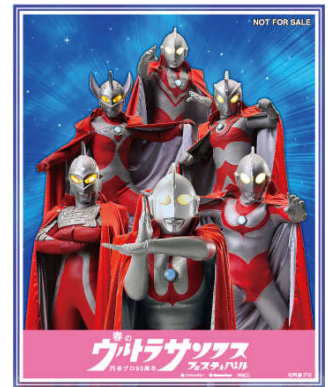
「ウルトラ兄弟オリジナルステッカー」

■パルコ: 札幌店・仙台店・浦和店・調布店・ひばりが丘店・新所沢店・静岡店・大津店・広島店 *開催期間は店舗により異なります