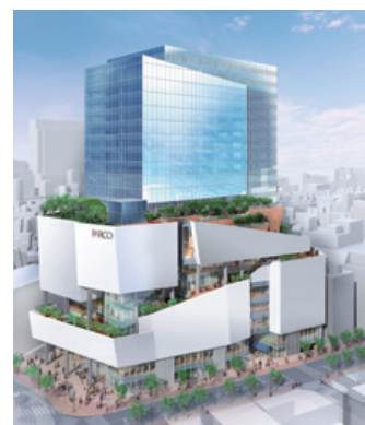
新生渋谷PARCO2019年秋完成イメージ