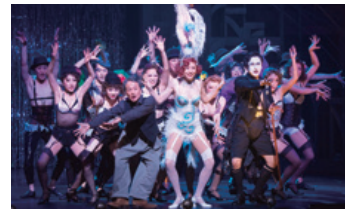
ミュージカル『キャバレー』松尾スズキ演出 2017年1月より東京EXシアター六本木ほか、神奈川、大阪、宮城、愛知、福岡にて上演

商業施設向けのICT活用戦略に注力し、「デジタルマーケティング」を通じた事業拡大を目指すため、2017年3月1日付で株式会社パルコデジタルマーケティングに商号変更しました。