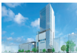
松坂屋上野店・新南館内イメージ