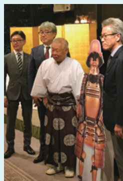
国宝「久能山東照宮」とのプロジェクト発表記者会見の様子

プロジェクトの成立支援にとどまらず、全国のPARCOが持つネットワークを活かし幅広く企画を提案しています。特に2016年11月に記者会見をおこなった国宝「久能山東照宮」徳川家歴代15代将軍夢のそり・踏みプロジェクトでは、静岡PARCOと連動し、プロジェクト成立後も継続してサポートしています。