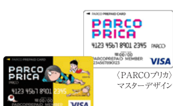
「PARCOプリカ」調布PARCO限定デザイン