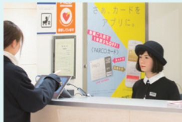
池袋PARCOインフォメーションカウンタースタッフとして1日接客(右:アンドロイド『U』)

大阪大学石黒研究室・株式会社ドワンゴと共同で、世界初のアンドロイド(人間型ロボット)をアイドルに育てる企画「アンドロイド『U』育成プロジェクト」をスタートしました。社会的存在感のあるアンドロイド+アイドル“アンドロイド”を目指します。また、アンドロイド『U』がお客様とコミュニケーションできる機会を提供していきます。