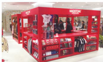
名古屋PARCO 西館1階 メンズ・レディース・雑貨「MADSTORE UNDERCOVER」

営業企画では、「個客」に向けたプロモーションの展開による顧客構造の高度化を図るため、「PARCOカード」について、新規会員の開拓強化、会員優待企画などの来店促進策の実施に加え、リニューアルした「POCKET PARCO」とのCRM施策により、同アプリと連携した「PARCOカード」会員の稼働向上と、顧客ロイヤリティの高いクラスS会員の売上拡大につながり、取扱高は前期比101.3%と伸長しました。また、12月より一部店舗への「POCKET PARCO」と連動したプライベートカード「PARCOプリカ」を先行導入し、CRMへの連携を強化しました。また、世界的に活躍するデザイン集団TOMATOの結成25周年を記念し、渋谷PARCO全体を巻き込んだエキシビション『THE TOMATO PROJECT 25TH ANNIVERSARY EXHIBITION "O"』や、PARCO各店舗では「ガンブラEXPO」など人気企画を展開し、話題性や来店客数増加に貢献しました。訪日外国人に対する施策として、免税や銀聯カードへの対応ショップ数拡大などのショッピング環境の整備に加え、外国人向けのメディアを活用した情報発信に取り組みました。