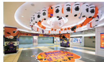
東京駅一番街(ハロウィンイベント) イベント企画提案・広告ビジュアル・ディスプレイを受注

株式会社パルコススペースシステムズは、受注物件の増加や契約条件の見直しにより売上総利益率が向上したことで、売上高、営業利益ともに前期実績を上回りました。パルコグループのデザインソフト機能部門として、商業空間のプロモーションやクリエイティブワークに携ったノウハウを活用し、他の商業施設から多数受注しています。