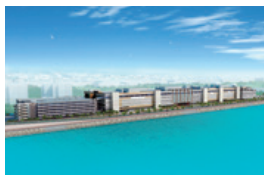
沖縄・浦添西海岸計画イメージ