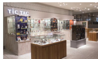
「TICTAC(チックタック)」 渋谷ヒカリエ店

株式会社スーヴ・エイは、前期より店舗数が増加したことにより、売上高は前期実績を上回りましたが、既存店の売上基調低下に加え、出店経費などの増加により、営業利益は前期実績を下回りました。