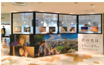
池袋PARCO 本館7階 THE GUEST cafe & diner「君の名は。カフェ」