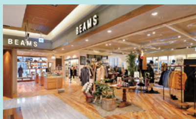
福岡PARCO新館 1階、2階 メンズ・レディース「BEAMS(ビームス)」

2014年11月13日には福岡PARCO新館開業、2015年3月19日には福岡PARCO本館 増床部が開業し、天神エリア最大級のショッピングセンターへと進化しました。九州初出店のカフェや高感度ファッションのセレクトショップ、地元で活躍する工芸作家やアーティストを紹介するギャラリー・ストアやアニメ・ゲームなどの新しいカルチャーを紹介するショップなどを取り揃え、生活の楽しさを提案していきます。