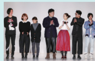
N.Yで行ったランウェイの最後に登場した選出されたデザイナー達