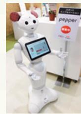
感情認識ロボット「Pepper(ペッパー)」によるお客様 対応インフォメーションアプリ開発。SCビジネスフェア での様子