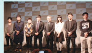
「BOOSTER(ブースター)」のプロジェクトオーナーとの記者発表の様子