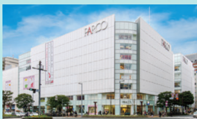
福岡PARCO本館+増床部 2015年3月19日開業、新館(右奥)2014年11月13日開業