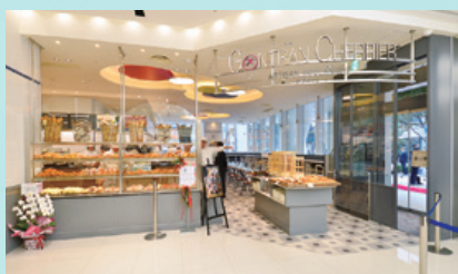
福岡PARCO新館 1階 ベーカリーカフェ「GONTRAN CHERRIER(ゴントラン シェリエ)」