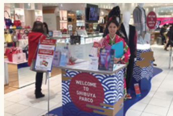
渋谷PARCO 2015年2月18日~24日 春節期間中に多言語対応カウンターを設置