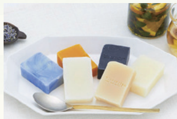
池袋PARCO 本館5階 2014年11月オープン 化学物質無添加の手作り石けんとオイルの専門店 「リルレシビ〜ナチュラルソープマルシェ」

株式会社ヌーヴ・エイは182店舗体制(新規出店18店舗)とオンラインストアの2つの販路で展開しています。積極的に新規出店を進めたTiCTAC(チッタック)事業や、アイウェア事業が全社業績を牽引しました。また、中期経営計画に基づく新規業態の開発も進め、二つの新業態も出店し、売上高、営業利益ともに前期実績を上回りました。