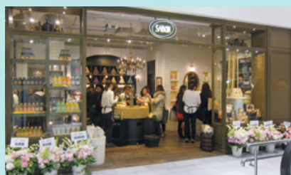
名古屋PARCO 東館 地下1階 化粧品・雑貨・ボディケア・コスメ「Sabon(サボン)」

名古屋PARCOでは秋の改装で西館のレディースフロアを中心に「自分らしさを楽しむ」大人の女性に向けたエリア初登場のショップや、福岡PARCO新館では食のテーマを充実させ話題のショップの導入などを行いました。また開業20周年の池袋P PARCO(ピーダッシュパルコ)では「都市型エンタテインメント」をテーマに動画投稿サイトのネット配信スタジオやアニメグッズのショップなど新しい消費ニーズに対応したショップを多数導入しました。