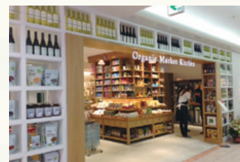
名古屋PARCO 西館2階 「Organic Market Kitchen(オーガニックマーケットキッチン)」