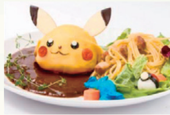
渋谷PARCO PART 1 7階 人気ゲーム「ポケットモンスター」とのコラボレーション カフェ「ポケモンカフェ」

株式会社バルコ・シティは、Webコンサルティング事業において、専門店などの既存クライアントからの受注が増加したほか、ショッピングセンターのICT戦略をサポートする新サービスとして、「人流解析(じんりゅうかいせき)」や感情認識ロボットによる接客対応インフォメーションアプリなどの開発をおこない新たなSC/専門店の皆様へのサービス提供を広げています。