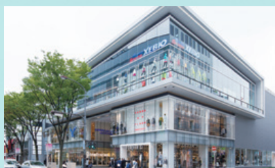
名古屋ZERO GATE 2014年10月10日開業