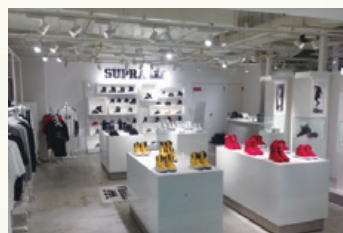
渋谷PARCO PART 1 地下1階 スニーカー「SUPRA(スーブラ)」