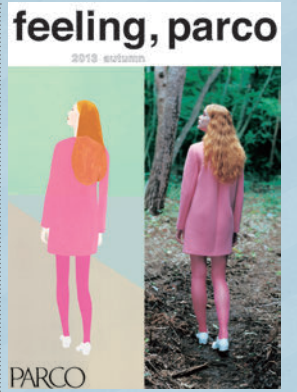
「秋のファッションキャンペーン」ポスター

2013年の秋冬トレンドといわれているパステルカラーを全体のキーカラーに、感覚が研ぎすまされ自身の周辺の「コト」や「モノ」が五感を通じて身体に入っていくかのようなイメージを、自然の中に佇む女性を写真とアートワークで捉えることにより表現しています。