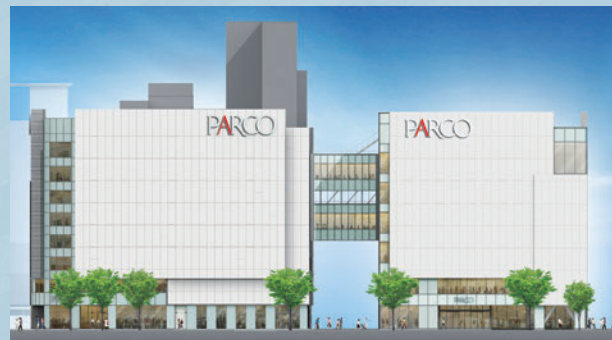
イメージ 左:福岡PARCO 右:福岡PARCO新館(仮称)

福岡PARCO隣地の早期活用を図るために、新たな商業施設として建替えを行い、「福岡PARCOと新館(仮称)」の2館体制にて運営する方針を決定しました。本社ストアオペレーション部内に設置した「福岡新館プロジェクト」を軸に福岡PARCOと連動し、開業に向けた準備を進めています。