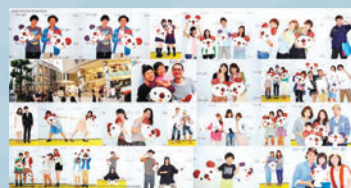
Webサイトの運営を軸に、パルコグループのO2O(オンライン・トゥ・オフライン)施策を推進