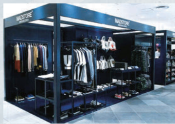
渋谷PARCO PART 1-1F UNDER COVERの日本初のコンセプトショップ「MADSTORE UNDERCOVER」

渋谷PARCO 40周年改装を継続し、ファッションとカルチャーの融合、グローバルな情報発信を強化。秋の改装では、TOKYOモードを発信できる日本ブランドの導入などファッション提案を強化したほか、デジタルガジェットゾーンの編集やストリートカルチャーの発信拠点を開設しました。