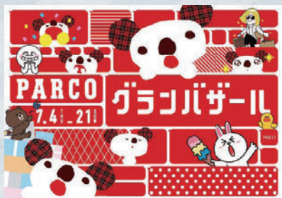
夏のグランバザールポスター 2013年7月4日(木)~7月21日(日)