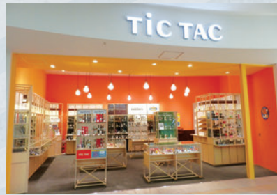
ららぽーと横浜 「TiC TAC(チックタック)」