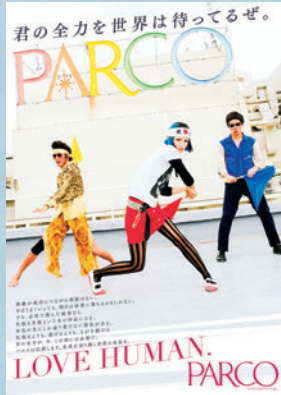
「シブカル祭。」にも参加している若手ロックバンド「N'夙川BOYS」を起用した「LOVE HUMAN.」ポスター

1969年の池袋PARCO誕生以来、ファッションのみならず、音楽やアート、演劇などのカルチャーを積極的に紹介、さまざまな新しい才能の発見や応援をし、都市のライフスタイルプロデューサーとして、その時代ごとに「コト」「モノ」「サービス」を融合させた、心豊かな生活を提案する店作りをしてまいりました。今の時代を見つめ直したときに、改めて、自信を持って未来を切り開いていく才能のある人たちを応援していく企業としての想いを伝えていきます。