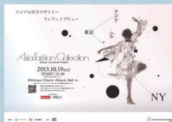
「Asia Fashion Collection ~ Global Incubation Project ~」ポスター

「Asia Fashion Collection ~ Global Incubation Project ~」は、次世代のファッションデザイナーの育成に取り組んでいる株式会社バンタンと連携し、次世代のアジアのファッションを担う若手デザイナーの発見と応援のための新たな取り組みです。パルコが持つ国内外の幅広いネットワークと事業活動を活かし、ファッションデザイナーとしてグローバルに活躍することを目指す若きデザイナーたちの発掘と、事業成長を支援します。