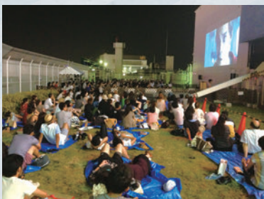
池袋PARCO・本館屋上 「SORA PARCO」のイベントの様子

*O2OとはOnline to Offlineの略で、例えばWeb上(Online)でクーポンを配布し、Web外(Offline)のリアル店舗に顧客を誘導するといった、オンラインとオフラインでの販売促進活動と購買行動を相互に連携させることを指します。