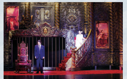
パルコ劇場40周年記念公演「黒蜥蜴」 会場:ル・テアトル銀座 by PARCO

株式会社パルコシティでは、Webコンサルティング事業において、タブレットを利用したタブレットサイネージやスマートフォン向けアプリの開発など、リアル店舗とWebを1つにつなげる事業を積極的に展開しました。EC事業では、パルコグループならではのカルチャー・エンタテインメントを軸にした独自コンテンツを拡充しました。