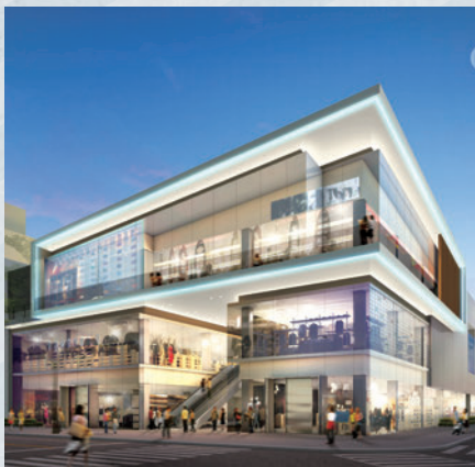
名古屋ゼロゲート(仮称) イメージ

2011年4月、渋谷ゼロゲートのオープンからスタートした新たな事業モデル「ゼロゲート事業」は、2013年4月に心齋橋ゼロゲート、道頓堀ゼロゲートがオープン、2013年10月には広島ゼロゲートがオープンしました。さらに名古屋・栄3丁目に5店舗目となる名古屋ゼロゲート(仮称)の出店を決定し、順調に進捗しています。