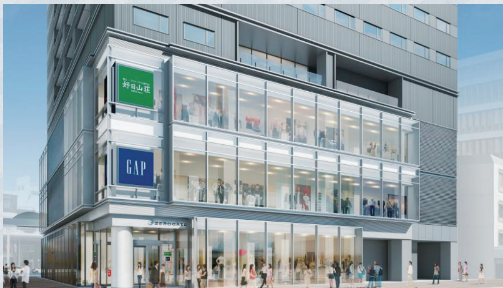
広島ゼロゲート イメージ 10月10日(木)オープン (出店テナント:アガット、デニム & サプライラルフローレン、アルマーニ ジーンズ、ジュール・フランス屋、Gap/GapKids、好日山荘)