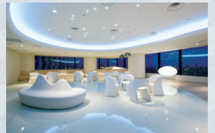
内装工事:日本赤十字 ソラマチ献血ルーム「feel」

株式会社パルコスペースシステムズでは、環境負荷低減に配慮した照明設計が評価され、医療系クライアントや大型商業施設などの新規内装工事受注が堅調に推移したものの、前期の商業施設におけるLED化工事受注の反動により、売上高、営業利益ともに前年同期実績を下回りました。