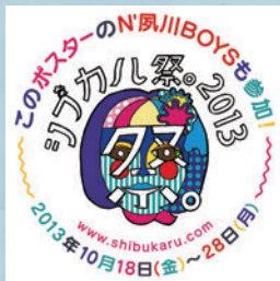
「シブカル祭。2013 ~フレフレ! 全力女子!~」ポスター

渋谷PARCO40周年という節目を迎えた2013年は、「応援」をテーマに、まだ世に出ていない才能を発掘し、新しいチャレンジに取り組む女子クリエイターたちによるさまざまな形の作品発表を行いました。