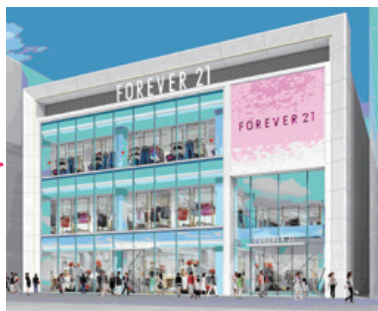
道頓堀ZERO GATE (仮称)「FOREVER 21(フォーエバー21)」

都心型中低層商業施設の開発運営事業「ZERO GATE事業」では、2013年春オープンの「心斎橋ZERO GATE (仮称)」へ「H&M(エイチアンドエム)」国内最大級店舗の出店が決定、同じく2013年春、「道頓堀ZERO GATE (仮称)」にアメリカ・カナダで代表的な人気ファストファッションブランド「FOREVER 21(フォーエバー21)」の出店が決定しました。2013年秋には「広島ZERO GATE (仮称)」のオープンも予定しており、順調に「ZERO GATE事業」は進捗しています。今後も都心部一等地において、立地の良さを生かした魅力ある商業施設の開発を推進していきます。