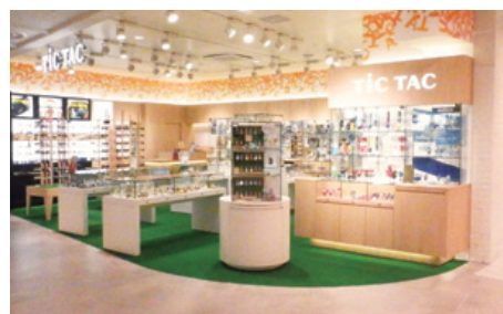
東京ソラマチ「TiCTAC(チックタック)」

株式会社ヌーヴ・エイは、156店舗体制(新規出店3店舗)とオンラインストアの2つの販路で展開しています。フレッシュズ向け企画と震災支援企画を組み合わせた『フレックタック』などが好調だったTiCTAC(チックタック)事業と、男性客の自家需要の回復および女性客のギフト需要の好調持続が奏功したコレクターズ事業が牽引し、売上高、営業利益ともに前年同期実績を上回りました。