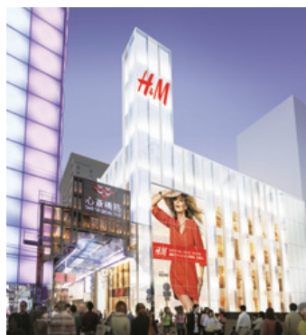
心斎橋ZERO GATE (仮称)「H&M(エイチアンドエム)」

2013年春「心斎橋ZERO GATE (仮称)」「道頓堀ZERO GATE (仮称)」オープン!