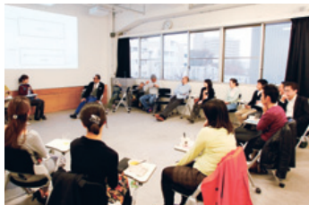
出資者とデザイナーが一緒になってブランドづくりを話し合うmy pandaクリエイティブ会議