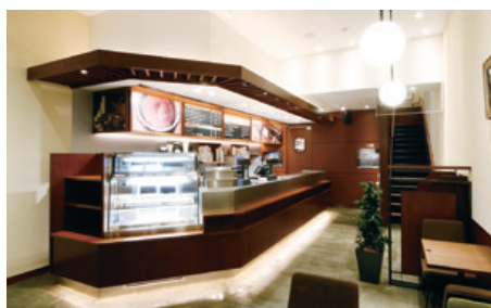
内装工事/照明設計・LED照明導入店舗 「上島珈琲店 仙台一番町店」

株式会社パルコスペースシステムズでは、PARCO各店舗の設備工事や外資系ホテルの客室関連業務、設備工事の受注が堅調に推移しました。また、公共・文化施設における屋外デジタルサイネージの導入や、商業施設・飲食店などにおける省エネ(環境負荷低減)に配慮した照明設計およびLED照明化の促進など、時代のニーズに合わせた「空間創造」を積極的に進めています。