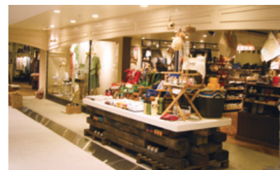
名古屋PARCO南館7F 「ニコアンド...」