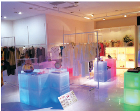
「デザイン」「スクール」「Web」「コミュニケーション」をミックスした情報発信型ショップ「びやるこ」

2013年、渋谷PARCOはPART1開業から40周年を迎えます。この節目の年に向け「原点進化」をテーマに大規模な改装を実施しました。既存のファッションビルのアイテム幅に収まらない要素を積極的に導入し「次世代パルコ」を提案していきます。