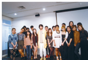
「PARCO next NEXT」シンガポールの若手デザイナーたち

「PARCO next NEXT」はシンガポールの若手デザイナーを育成するために2010年3月にスタートしたファッションインキュベーションプロジェクトで、2012年で3期目を迎えます。これまで37ブランドのサポートを行い、今回は18組のデザイナーを選出しました。今後1年間にわたりクリエイティブおよびビジネスの研修プログラムを提供します。シンガポールのPARCO Marina Bay内の販売スペースへの出店機会のほか、2012年3月には「渋谷PARCO」で期間限定ショップをオープンするなど、グローバルな取り組みを行っています。