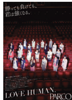
エンタテインメント編