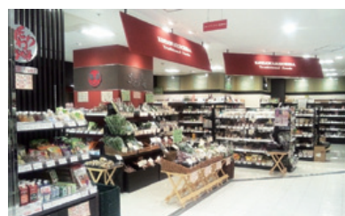
吉祥寺PARCO地下1F「こだわり市場」