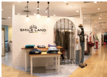
nissenが運営するラーゼサイズ専門店「スマイルランド」