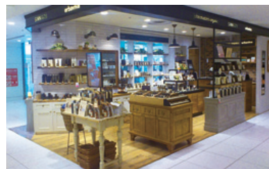
池袋PARCO本館1F 「ジョンマスターオーガニック・エルバピーバショップ」

海外事業については、中国現地法人「百樂和商業諮詢(蘇州)有限公司」を設立し、蘇州市工業園区内「尼盛広場プロジェクト(仮称)」の商業施設の運営管理業務を推進しています。また、オープン2周年を迎えたシンガポールの「PARCO Marina Bay (パルコ・マリナー・ベイ)」では、地元デザイナー育成ゾーン「PARCO next NEXT」にて第3期のデザイナーたちがデビューしました。