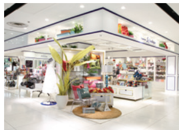
株式会社パルスの新業態となる雑貨・インテリアショップ「フランフラン ラ・プティック」