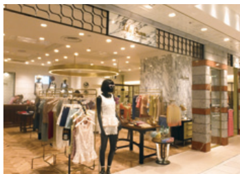
ヴィンテージテイストを現代にプレイクダウンした独自のデザインで人気の「リリーブラウン」