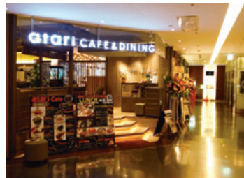
「健康」「ヘルシー」をテーマにした「atari CAFE & DINING」