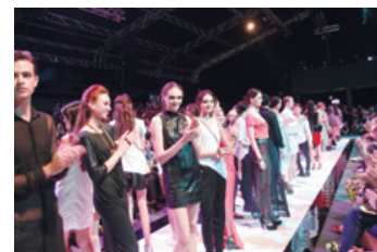
アジア最大のファッションショー AFXランウェイショー