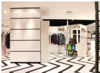
「かろうじて服」というコンセプトのカジュアル衣料品ブランド「CUNE」