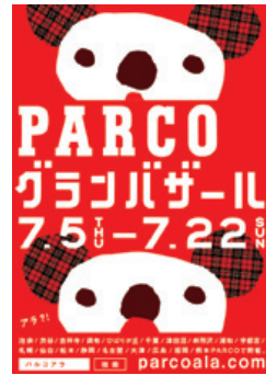
夏のグランバザールDM

バーゲンセールだけではなく、気軽に立ち寄って楽しめるパルコ限定イベント『ガリガリ君祭り in PARCO』や、『夏フェス』『ビーチ』でのお洒落を提案するショップをオープンし、欲張りな夏にピッタリなファッションアイテムを提案しました。