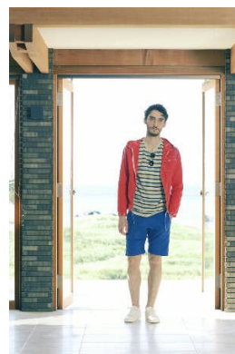
渋谷パルコパート1・1F「MADSTORE UNDERCOVER」