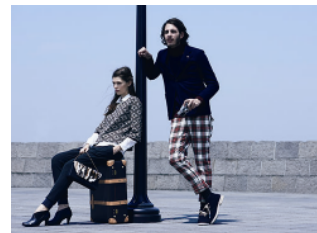
左：ジョイリッチ 右：ビームスライツ