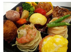
左：エチュードハウス 右：Sozai-ya Hanamaru