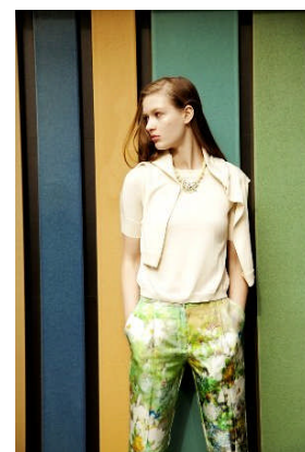
左：ユーモアマーケット by エイネット