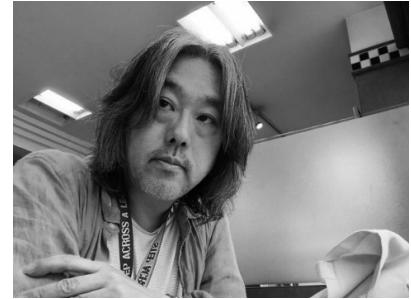
●監督&脚本 太田 隆文

青春ファンタジー「ストロベリーフィールズ」で劇場映画デビュー。毎回、涙が止まらない感動を作り、海外の映画祭から招待、高い評価を受けている。「朝日のあたる家」は海外7カ国で上映。脚本はすべて自身でオリジナルを執筆。きのくに芸術新人賞・無煙映画大賞を受賞している。