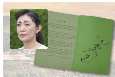
●田中美里サイン入り台本