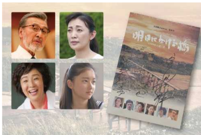
●豪華出演者サイン入りパンフレット