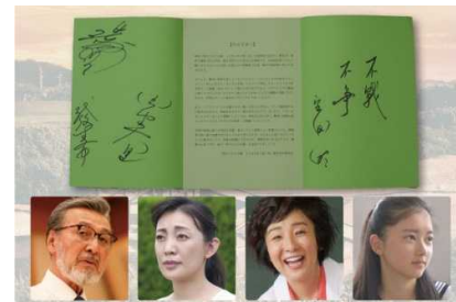
●豪華出演者サイン入り台本