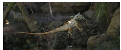
上) iZoo（イズー）園内動物