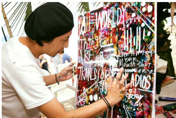
アクリル絵の具を使ったライブペインティングを中心に活動