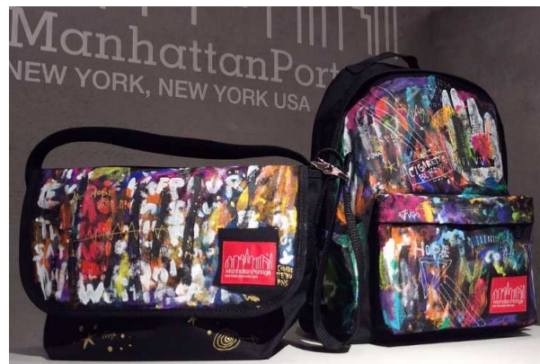
Manhattan Portage などファッションブランドとのコラボ商品も発売