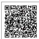
TICTACオンラインストア 対象ブランドページはこちら

【期間：2015年10月1日(木)～11月30日(月)まで】 期間中、株式会社ヌーヴ・エイ ブランドの各ショップで本誌に掲載の対象商品お買い上げ1点につき、50円以上を寄付します。 また一部商品につきましては、オンラインストアでも販売しておりますので、そちらでお買い上げいただいても、店頭と同様の寄付をいたします。