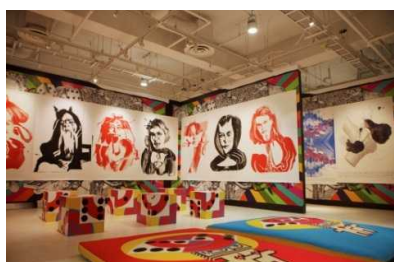
左) 女性クリエイターたちの文化祭「シブカル祭」 右) アーティスト集団「Chim ↑ Pom」の展覧会