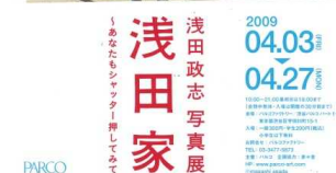
若手から巨匠まで注目のフォトグラファーの写真展を実施