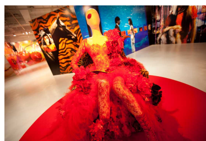
個展「ヘルタースケルター」(2012年・パルコミュージアム)