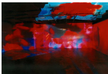
個展「Liquid Dreams」(2003年・パルコミュージアム)