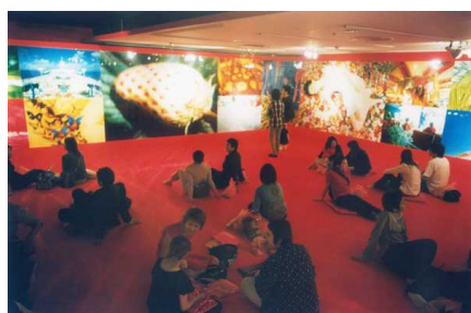
個展「まろやかな毒景色」(2001年・パルコギャラリー)