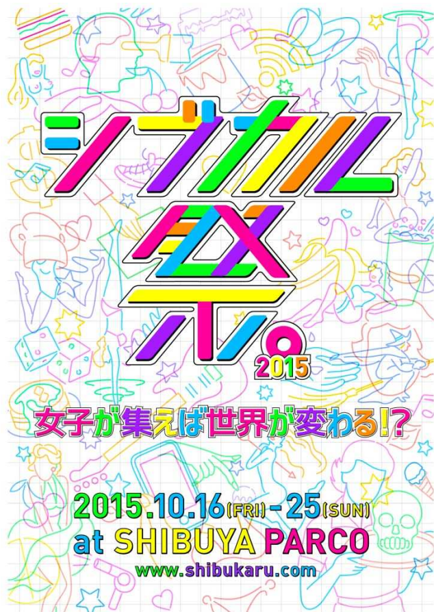
2015 メインビジュアル

本年も、5回目となる女子の祭典「シブカル祭。2015」を開催いたします。「女子が集えば世界が変わる!?」というキャッチコピーのもと、自分だけの表現を続ける女子クリエイターが集結。女子のパワーを、渋谷からもっと広い世界へと発信していきます。さらなる混沌を極めた濃厚な10日間。進化を続ける「シブカル祭。2015」にご期待ください。参加クリエイター・イベントの詳細は、随時、公式ホームページ・SNSで発表していきます。